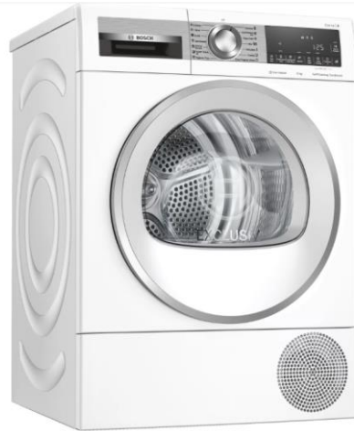
Serie | 6 WQG24590BY

Kapacitet: 9 kg Energetski razred: A++ Sustav: SelfClean