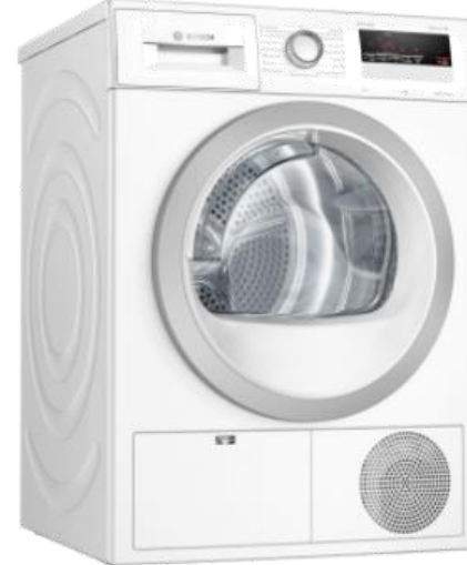
Serie | 4 WTH85291BY*

Kapacitet: 8 kg Energetski razred: A++ Sustav: EasyClean