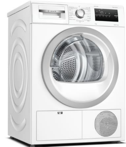
Serie | 4 WTH85292BY

Kapacitet: 9 kg Energetski razred: A++ Sustav: EasyClean