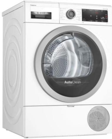
Serie | 8 WTX87M90BY

Kapacitet: 9 kg Energetski razred: A++ Sustav: AutoClean